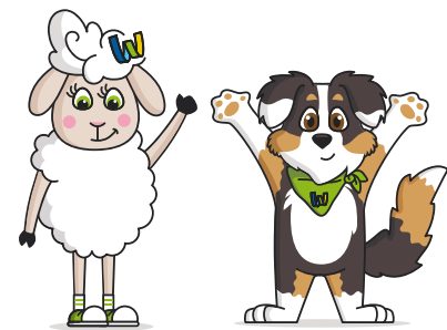
wendä & Linus

Wer seine Kinder auch bei der Übernachtung zum Staunen bringen möchte, wird ebenfalls fündig: Auf dem Campingplatz Bostalsee warten Märchenhäuser mit Spielgeräten darauf, die Kinder zu verzaubern.